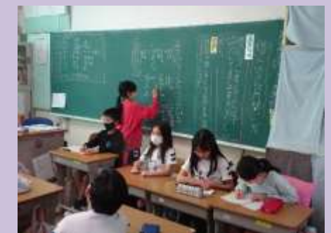
クラスの目標決め