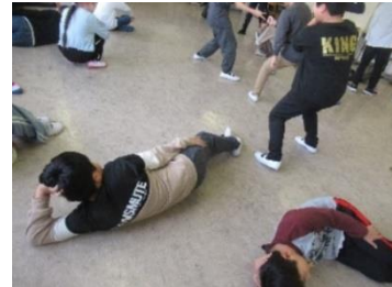
6年生インプロ授業 自分なりの「作業をさぼっている場面」の演技