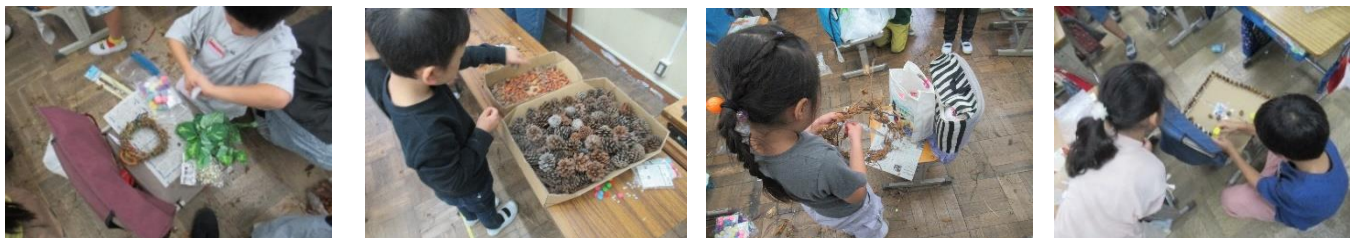
1年生 春から夏にかけて朝顔を育てました。栽培と観察が終わったら乾燥させたツルでリースを作りました。

子どもの心を豊かに揺さぶり、多くの体験やあそび、育ちに出会わせてくれるのが自然です。1年生の生活科では季節に沿って身近な自然や社会とかかわりながら活動を展開していきます