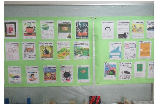
先生のおすすめの本は図書室前に掲示しています。