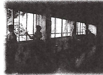
「きれいになりました！」

10月27日(金)保護者のボランティアさんが、普段職員や子どもたちの手が行き届かない窓を清掃してくださいました。おかげさまで見違えるようになりました。職員の甘えのように思われるかもしれませんが、清掃に限らず、できればもっともっと頻繁に、そして気軽に保護者の皆さんが学校に来ていただけるような機会を作れるといいなと思っています。子どもたちのために、子どもたちを取り巻く全ての大人で支える学校でありたいと思います。急なお願いにもかかわらず、駆け付けてくださった保護者の皆様、感謝いたします。ありがとうございました。今後ともどうぞよろしくお願いいたします。