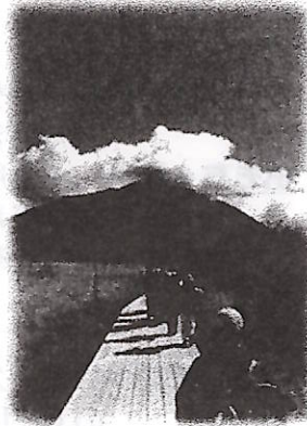
「戦場ヶ原ハイキング」