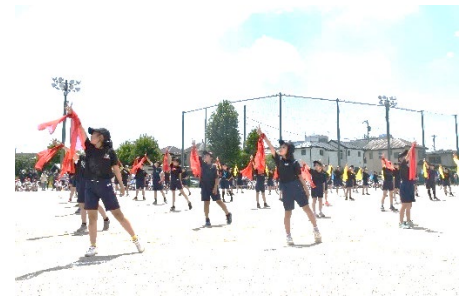
5年「Go all out！」