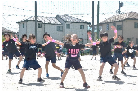
4年「なないろのハロー！」