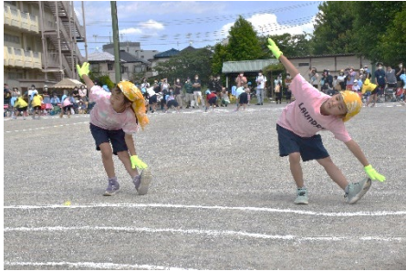
1年「ほく・わたしをとってね Take a picture」