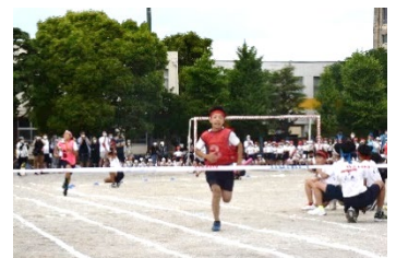
白熱した紅白リレー