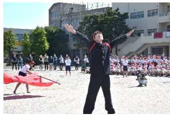
応援合戦も盛り上がりました！気合の入った紅白応援団長