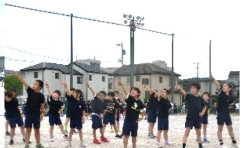
3年「Permission to Dance～笑顔を届けよう～」