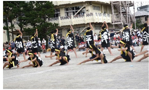
6年「菅野ソーラン～飛翔～」