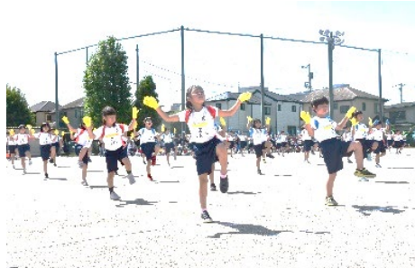
2年「フレー！フレー！うたエール」