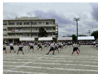
3年・菅野にサチアレ