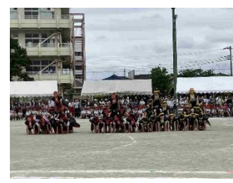
6年・最高のソーラン