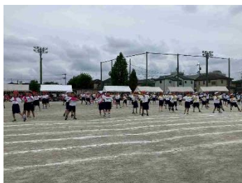
1年・「主役は1年生 ー青と夏ー