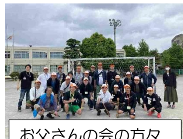
お父さんの会の方々

地域の方からは子どもたちはもちろん、先生たちも素晴らしかったとお話をいただきました。たくさんのご声援とご協力をありがとうございました。