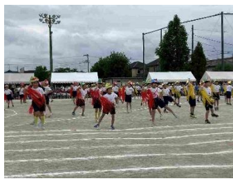
2年・かいじゅうの花うた♪