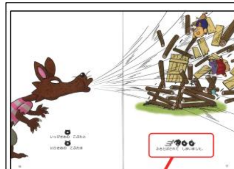
埼玉福祉協議会 LLブック