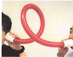
とちゅうをまげる