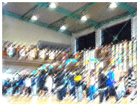
1・6年生ペアによる入場

6年生は、3月14日に卒業式を迎えて、4月からは中学生になります。中学校は、自分の夢に向かって大きく前進できる場所だと考えます。在校生も1か月後には進級します。全児童の皆さんに、1年間を振り返って、これまで経験したことを糧に、さらに成長していくことを期待しています。