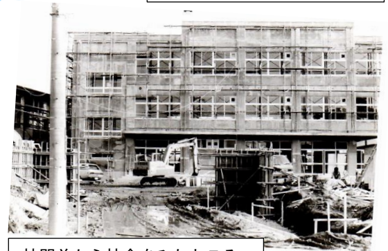
校門前から校舎をみたところ

南新浜小の特徴としては、学校の眼前に、宮内庁新浜鴨場があるため、建築物に高度制限があり、校舎は3階までしか建てられず屋上がありません。しかし、校庭はとても広く、緑の少ない地区でありながら鴨場の木々が格好の自然を今も提供してくれています。