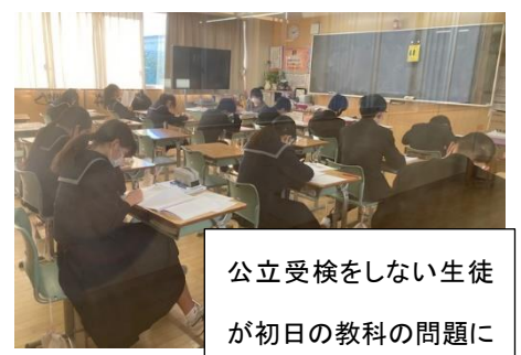
公立受検をしない生徒が初日の教科の問題にチャレンジしました。