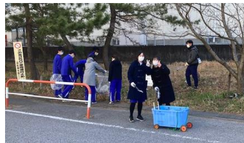
9年生地域清掃活動（卒業前の恩返し）

結論から申し上げますと、塩浜学園の児童生徒は、 今の姿をありのまま受け入れられるという素晴らしさ（転入してきた児童生徒への優しい対応など）を持っていると思います。 「ICTに強い」や「理数系が得意」というような特徴とは異なりますが、 「一人一人を大事にできる風土がある」というのが「塩浜がすごいと言われるところ」 だと感じています。実際に、本校には広い範囲から児童生徒が通い、外国につながる児童生徒もたくさんいます。それぞれが互いに認めあえる環境にあり、いわゆる「多様性」に富んだ学校です。このことが、学校教育目標に掲げる「心豊かでたくましく生きる児童生徒」につながっています。卒業生には、「一人一人を大事にする気持ち」を持ち続けてほしいと願っています。私たち教師の使命は、一人一人を大事にししながら、子どもたちの実感の中に「今、ここを大事にする気持ち」＝「塩浜学園プライド」を育てることです。そのために、「塩浜ふるさと防災科」を創設し、1～9年生がともに学びあうような仕組みを取り入れています。学校ですから、様々なトラブル・問題も発生します。しかし、問題が起こるのは、課題があるからです。その課題を解決し、良い方向に向けること（問題や課題を解決していくこと）が成長に繋がります。子どもたちが挑戦を大切にすること、失敗することを恐れないことを支えていける教師集団でありたいと思っています。