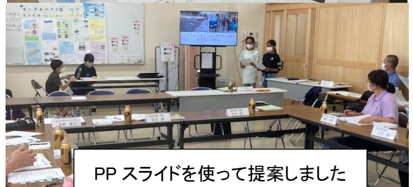
PPスライドを使って提案しました