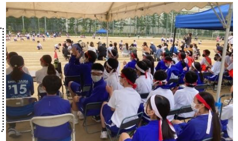
競技を見守る8・9年生（係生徒）