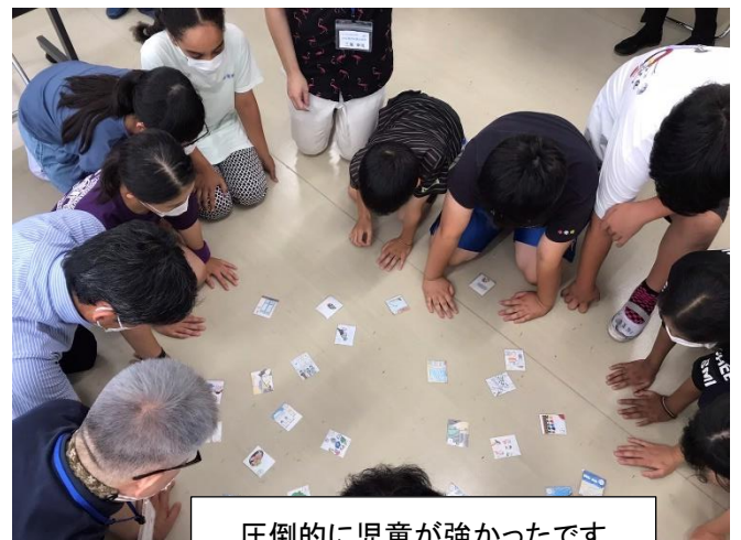
圧倒的に児童が強かったです