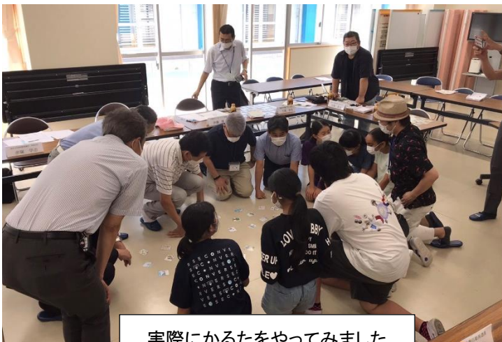
実際にかるたをやってみました