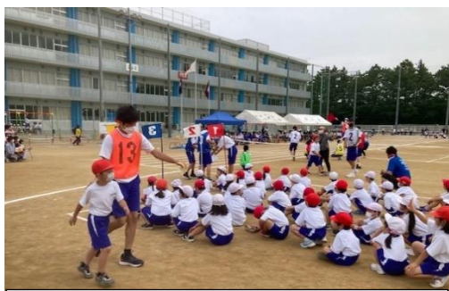
係はLブロック生徒+5・6年体育委員