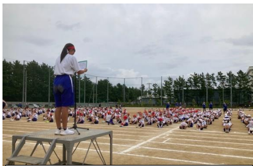
成績発表の場面 紅組が逆転優勝！