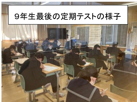
9年生最後の定期テストの様子

オリンピックを通して、オリンピックのおかげで多くの人々が チャレンジ・プロセスを讃えられる 人に成長してきたと感じています。 これが質の違う感動につながっているのだ と思います。