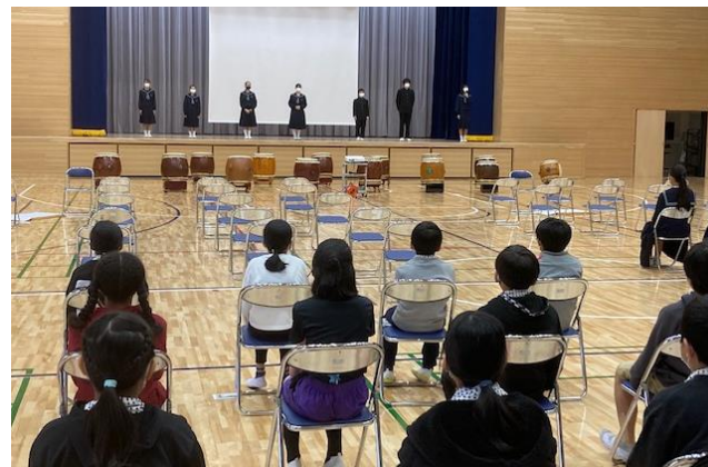
新執行部代表挨拶(会長)