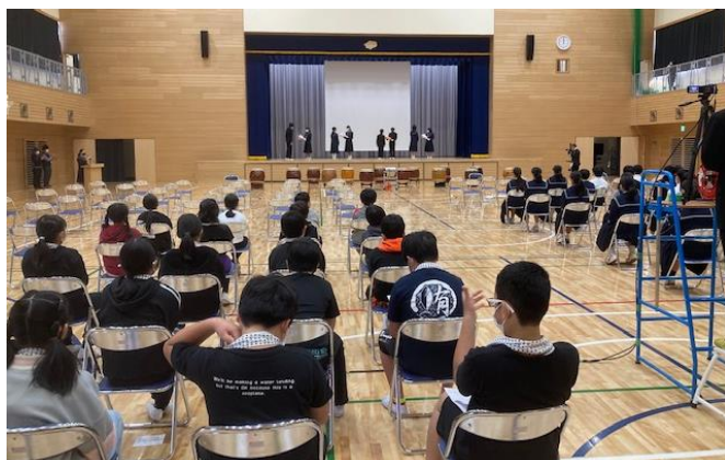
旧役員への花束贈呈