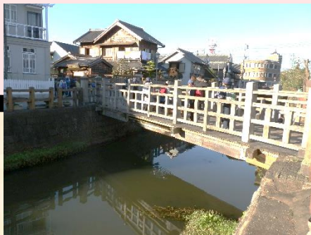
▲ 佐原の街並みと樋橋