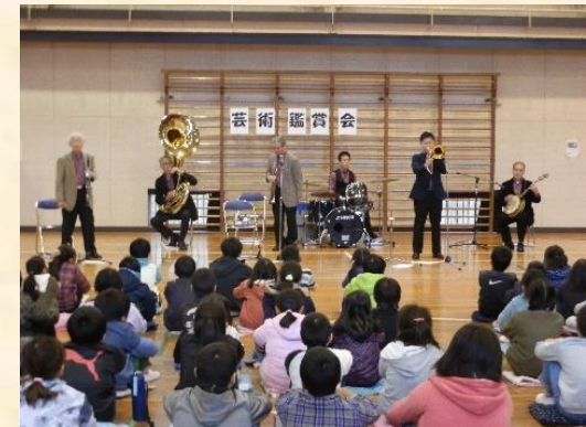
芸術鑑賞教室の様子