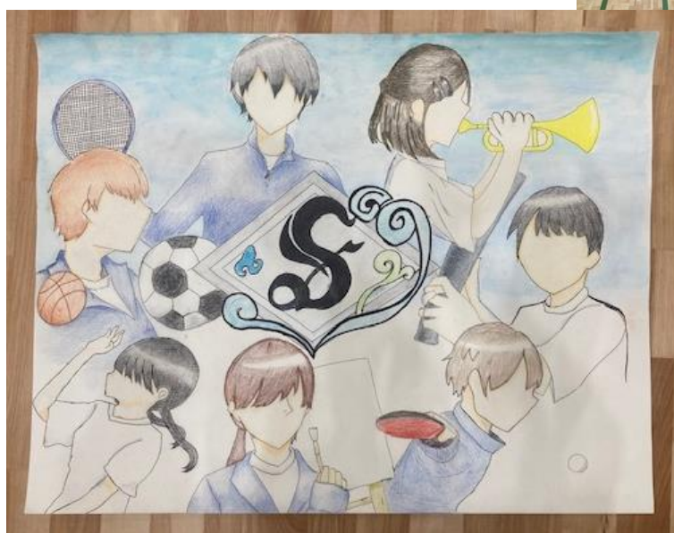
激励ポスター(美術部が作製・校内掲示)