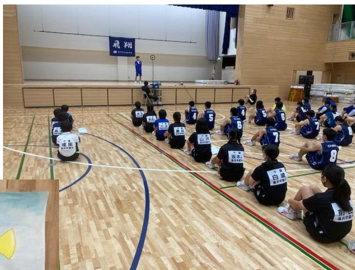
在校生代表の言葉(体育館)