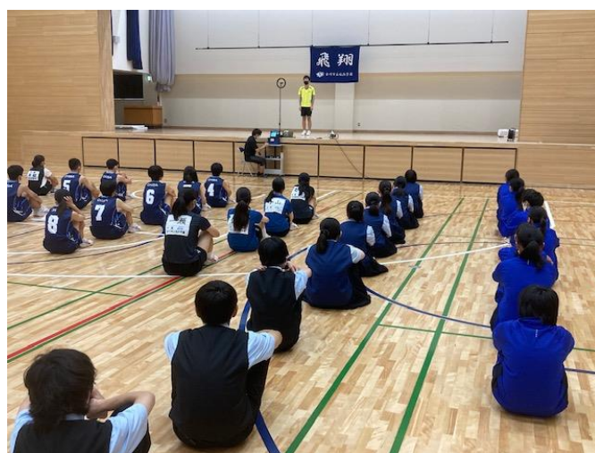
代表の言葉を真剣に聞く9年生(体育館)