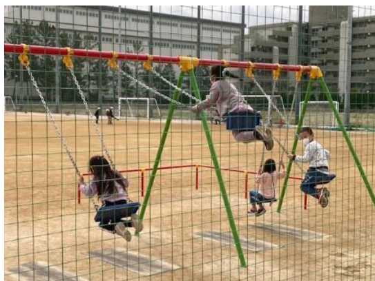
子どもは風の子(1年生)