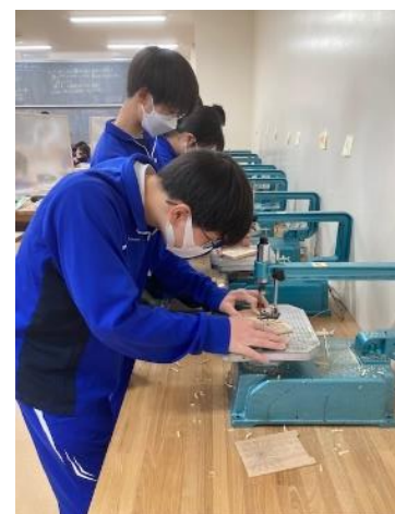
糸ノコで作製(8年生)