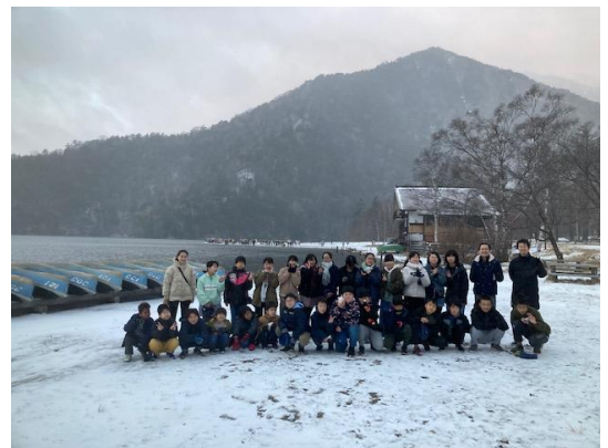
2日目の朝、湯ノ湖前での記念写真

感染状況が改善傾向となり、「県外への修学旅行」が実現しました。冬の足音が聞こえる中、日光方面1泊2日の旅でした。日光東照宮では、ガイドさんの説明をしっかりと聞き、多くのことを学びました。きらびやかに輝く陽明門、壮大な華厳の滝、夕陽に染まる男体山、迫力ある湯滝、雪景色の湯ノ湖、いろは坂の野生ザルなど、「素晴らしい景色」に出会いました。各自が役割を誠実にやり切り、正に「学びのある」＝「修学」旅行となりました。