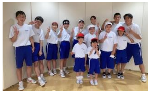
嵐潮祭閉会式で活躍した児童生徒代表

S・M・Lの3ブロックで頑張った嵐潮祭から半月が経過しました。全体としては、日常の活動が戻ってきた感じで、落ち着いた様子です。6月はじめには、教育相談(5～9年)を実施しました。保護者の皆様に相談する必要があることについては、個別にご連絡いたしました。