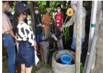
県環境研究センター 地質環境研究室