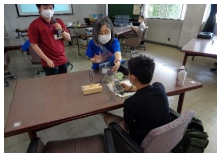
県環境研究センター 大気騒音振動研究室