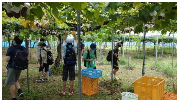
千葉大学環境健康フィールド科学センター