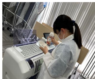
株式会社MCCマネジメント (マツキヨココカラ&カンパニー)