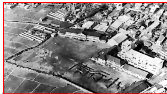
昭和40年代前半、すでに1棟が建てられています

10月9日は、南行徳小学校の創立記念日です。今から150年前、明治6年(1873年)に行徳小学校の分校から独立して、拡智小学校という名称で開校しました。その後、いくつかの名称変更や合併等があり、昭和31年(1956年)に南行徳町が市川市と合併したことで『市川市立南行徳小学校』になりました。最初に校舎ができたのは、大正11年(1922年)のことです。それまでは、源心寺等のお寺を借りて勉強していたようです。現在の校舎は、1棟が昭和41年(1966年)、2棟が昭和50年(1975年)、3棟が