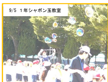
9/5 1年シャボン玉教室