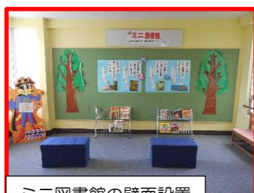
ミニ図書館の壁面設置