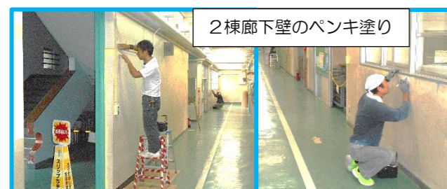
2棟廊下壁のペンキ塗り