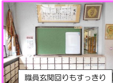
職員玄関回りもすっきり