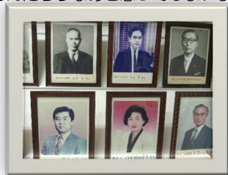
〈歴代の校長先生の写真〉

校長室に歴代の校長先生達の写真が飾ってあります。この写真をふと見ると、「みんなやっぱり、おじいちゃんだなあ」と思えます。写真の校長先生達は、多分今の私と同じぐらいの歳だろうと思います。子ども達から見るとこのようにおじいちゃんに見えるんだらうなあと思ってしまいました。そんな時、休み時間に校庭で1年生の男の子が近寄ってきて、「うちのジイジと同じ匂いがする」と言いました。「ああ、若いつもりでも、やっぱりな」と現実を知らされました。でも、毎日子ども達とのふれあいは、最高の幸せとっております。