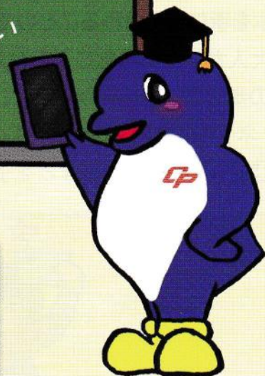
千葉県警察マスコットキャラクター 「シーポック」