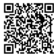
学校ホームページ QRコード