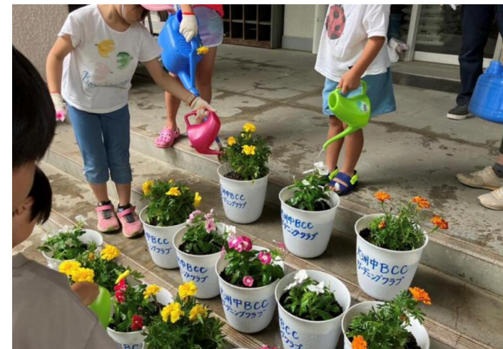
ガーデニングクラブ