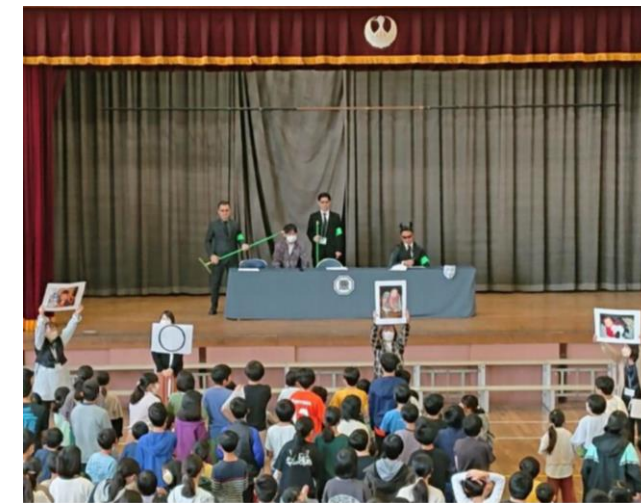
秋のワクワクフェスティバル