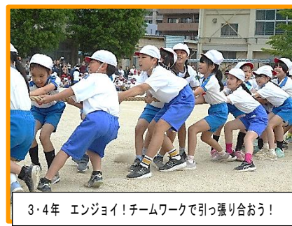
3・4年 エンジョイ！チームワークで引っ張り合おう！