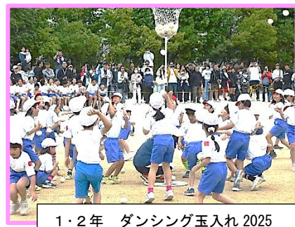
1・2年 ダンス玉入れ 2025

「最後まで全力応援 大洲っ子」をテーマに、仲間とともに作り上げた運動会は、学年や学級の団結力を高め、互いのつながりを深めたと感じています。やはり、学校行事の持つ意味はとて大きく、運動会を通して社会性を形成する、思いやりや協調性が育まれたと思います。