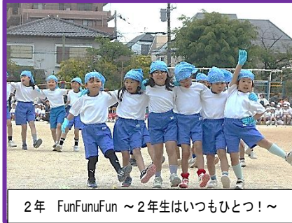
2年 FunFunFun ～2年生はいつもひとつ！～