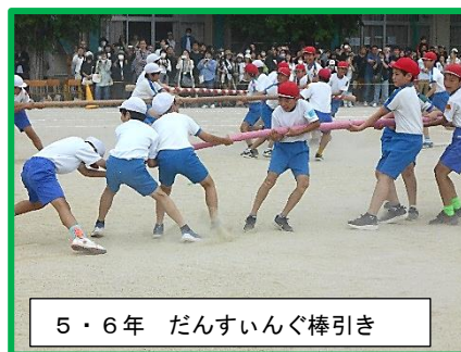
5・6年 だんすいんぐ棒引き