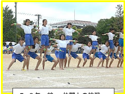
5・6年 絆 ～仲間との挑戦～