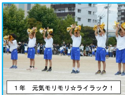
1年 元気モリモリ☆ライラック！