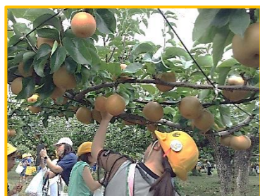
3年校外学習（梨園見学）