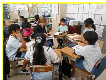
5年学校支援実践講座