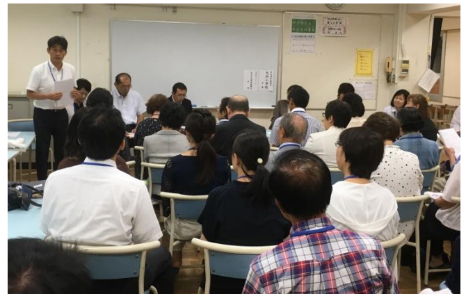
提案に真剣に耳を傾ける3校・1園の委員

大洲中ブロックの学校運営協議会のメンバーは、それぞれが地域学校協働本部を構成する各組織の一員でもあり、大洲中ブロックの合同会議でビジョンを共有して進めていくことが、子ども達の未来のために必要だと考えています。