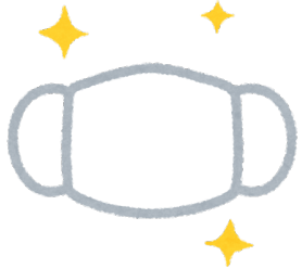
Spare mask 备用面具