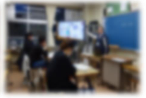
じゅぎょう ようす 授業の様子