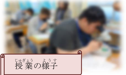
じゅぎょう ようす 授業の様子