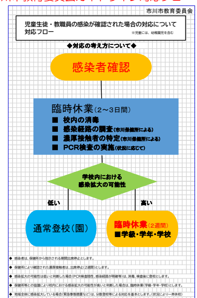
市川市教育委員会ガイドライン対応フロー