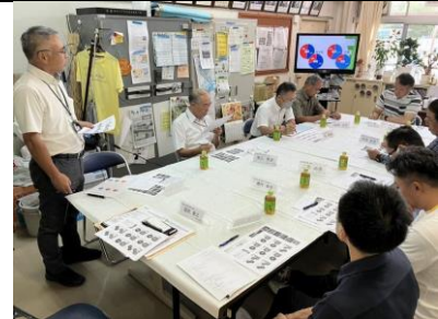
第2回 学校運営協議会