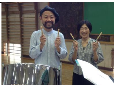
2年 スチールパン演奏会