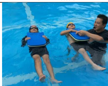
なかよし 着衣泳指導