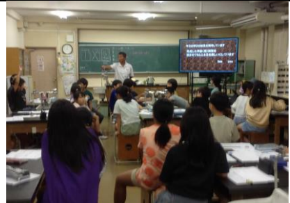
4年 新聞づくり教室