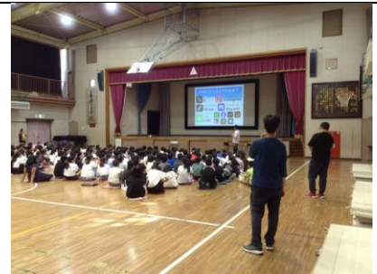
5・6年 インターネットトラブル教室