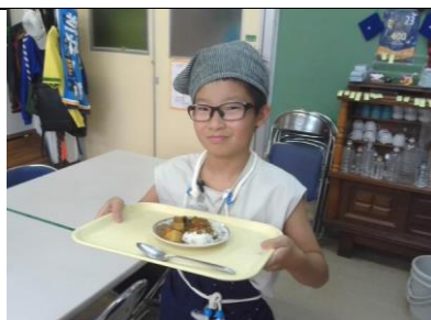
なかよし 調理実習