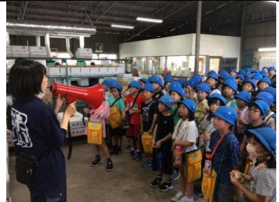
3年 迎米選果場見学