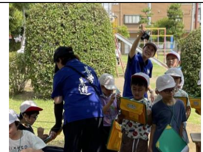
なかよし 公園探検