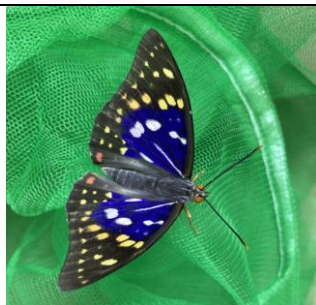
オオムラサキ誕生！