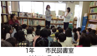
1年 市民図書室 オリエンテーション