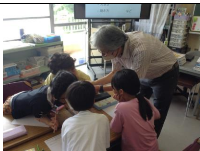
3年 オオムラサキ教室