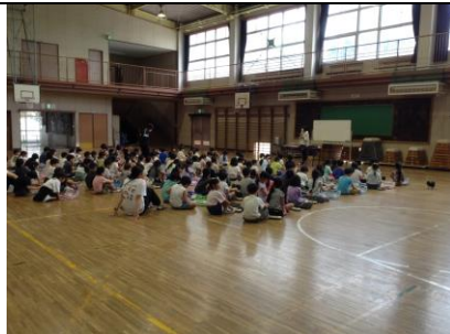
1年 鍵盤ハーモニカ講習会