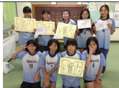
大柏ユナイテッド FC