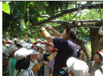
3年 梨園見学 袋がけ