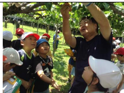
3年 梨園見学 摘果(てきか)