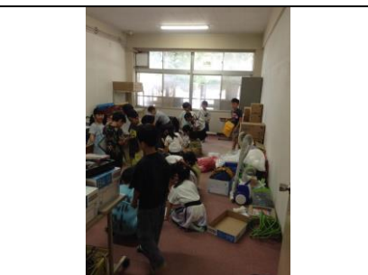
1年 学校探検パート2