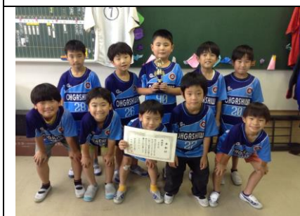
大柏サッカークラブ