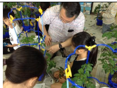
2年 野菜の苗の世話