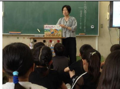
読み聞かせボランティア