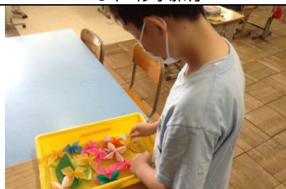
なかよし アサガオ(折り紙)づくり