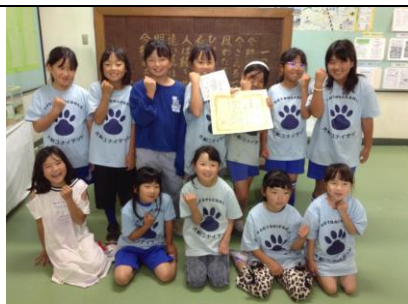
大柏ユナイテッド FC