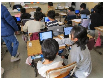
1年生にタブレット届く！