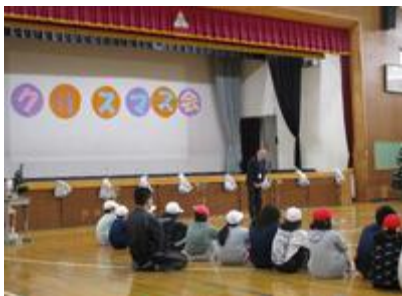
なかよし 合同クリスマス会（五中）