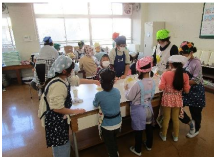
なかよし ポップコーンづくり