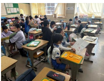
イチョウタイム 3・5年