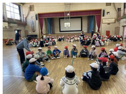
イチョウタイム 2・4年