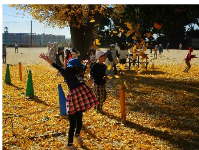
遅れた秋を楽しむ子ら