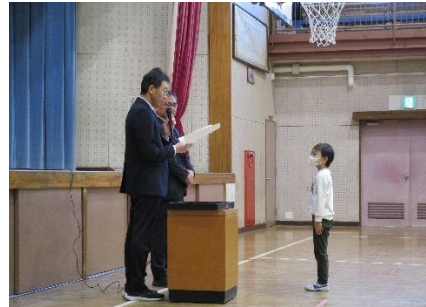
表彰 ユネスコ絵画展