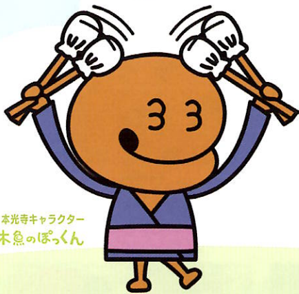
本光寺キャラクター 木魚のぽっくん