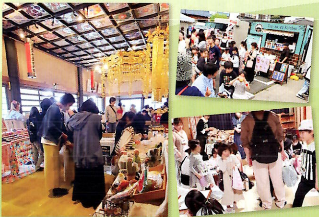
前回(2024.4月)開催の様子