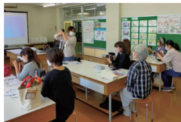
カメラ講座の様子