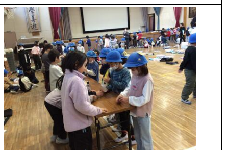
1・2年 おもちゃ大会