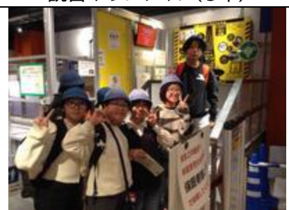
6年 校外学習(都内見学)