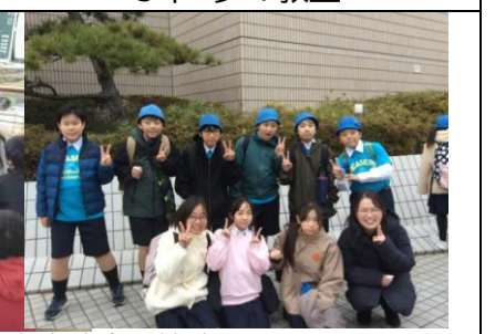
吹奏楽部 管楽器フェスティバル