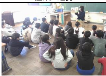
読書ボランティア(6年)