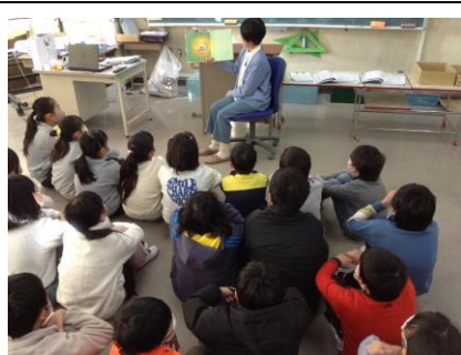
読書ボランティア(5年)