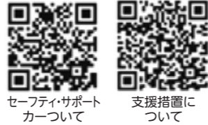
セーフティサポートカーについて