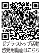
ゼブラ・ストップ活動啓発動画はこちら

また、交通事故の中には、歩行者側にも交通ルールの違反があるものも見受けられます。歩行者も交通ルールを守り、道路利用者が一体となって交通事故防止を図りましょう。