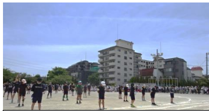
5年生 わるい「クセ」をすてた「私は最強」!!