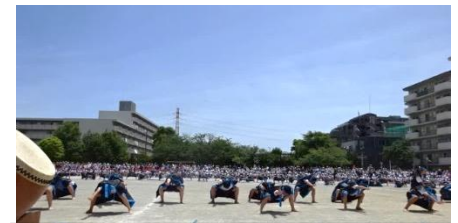
6年生 新浜ソーラン2023 ~青と夏~