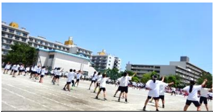
4年生 新浜さんさ踊り 2023!!