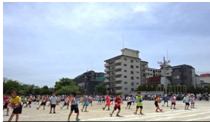
2年生 チグハグだっていいじゃない 2年生だもの