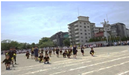
1年生 ダンス・ダンス・ツバメっ子

表現の演目については練習段階から各学年の様子をみていましたが、2週間ほどの練習で子ども達がどんどん上手くなっているのがよく分かりました。多くの子どもたちは自分たちの演技に満足していたようですが、中には体を動かすことなどが苦手な児童もいることから、結果や成果だけでなく、今までの取り組みや伸びた点を評価していきたいと思っておりますので、ご家庭でもそのような視点から子供たちを励ましていただけたらと思います。また、当日は多くの保護者の皆様に応援にいただいたうえ、観戦マナー等についてもご協力いただきありがとうございました。