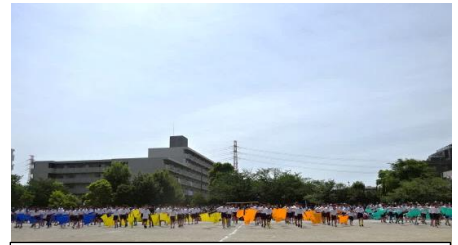
3年生 新浜 スリーフラッグ