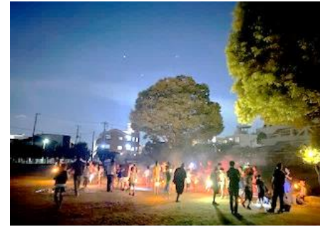
花火大会の様子。最後は打ち上げ花火もしました。

さて、このような中、新浜小学校のおやじの会主催で、8月26日（土）におやじキャンプが実施されました。当日は40名を超える児童の参加がありました。体育館は暑かったので、班ごとにクーラーのきいた部屋に分かれてピナータ作りを始め、水鉄砲大会、カレー作り、そして