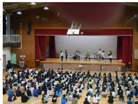
始まりの会での、アンサンブル演奏

ので、この3学期は各学年のまとめの学期となります。また、この学期はとても短く、1年生から5年生までが52日間、6年生は卒業式まで47日となります。このあっという間の3学期をどのように過ごしていくかは次の学年に向けてとても大切になると思いますので、教職員一同子ども達の支援をしっかりと行ってきたいと思っております。