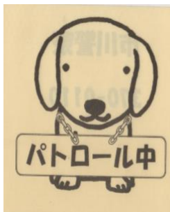
「防犯パトロール」プレート