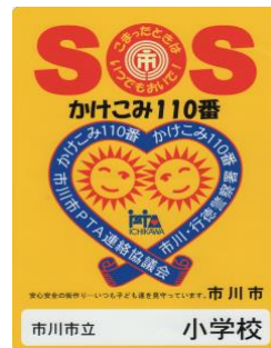
「かけこみ 110 番」プレート

いざという時に子どもたちが逃げ込めるように玄関先や 敷地入り口付近に掲載する 市川市統一のプレート