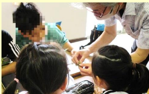
3年生「オオムラサキについて」

学校ホームページでも紹介していますが、今学期も講師を招いての学習をはじめとして、体験的な活動を行っています。子供たちは、質問するとなんでも答えてくださる、講師の先生の専門性に驚いたり、優しさに触れたりと貴重な体験となりました。学習の目的をしっかりと考え、振り返り等も充実させた体験的な活動の充実を図っていきたいと考えております。