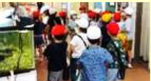
2年生「1年生との学校探検」