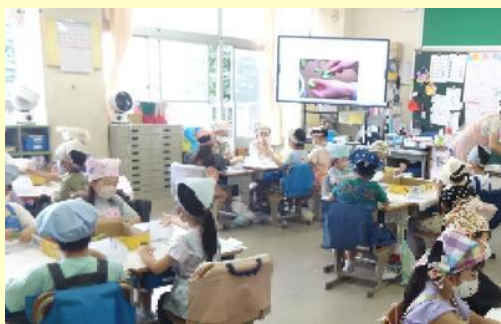
1年生「そらまめのさやむき」