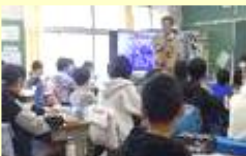
6年生「市川の縄文時代について」