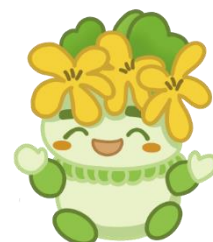
千葉県子どもと親のサポートセンター マスコットキャラクター こざぼん