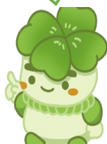
千葉県子どもと親のサポートセンター

<千葉県子どもと親のサポートセンター住所> 〒263-0043 千葉市稲毛区小仲台5-10-2 千葉県子どもと親のサポートセンター 支援事業部 電話 043-207-6028