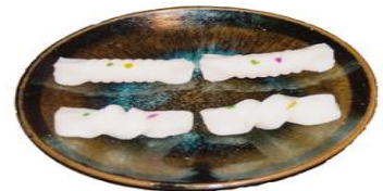
現在のしんこ菓子