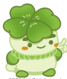
千葉県子どもと親のサポートセンター マスコットキャラクター こさぼん