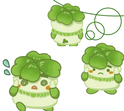
千葉県子どもと親のサポートセンター マスコットキャラクター こさぼん