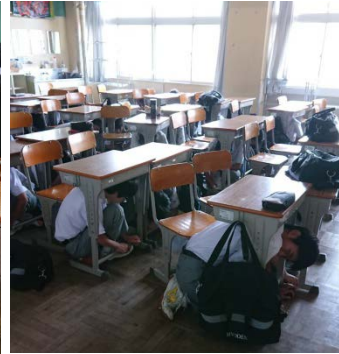
*「ドロップ」「カバー」「ホールドオン」 良くできています。