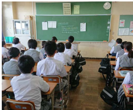
*姿勢よく静かに聴いていることが素晴らしい！！