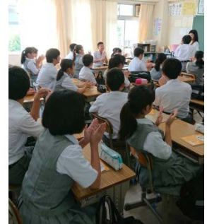
*仲間の表彰を拍手で祝福

是非、何事においても、正しい準備ができる妙典中の雰囲気をもみんなの力でつくっていきましょう。